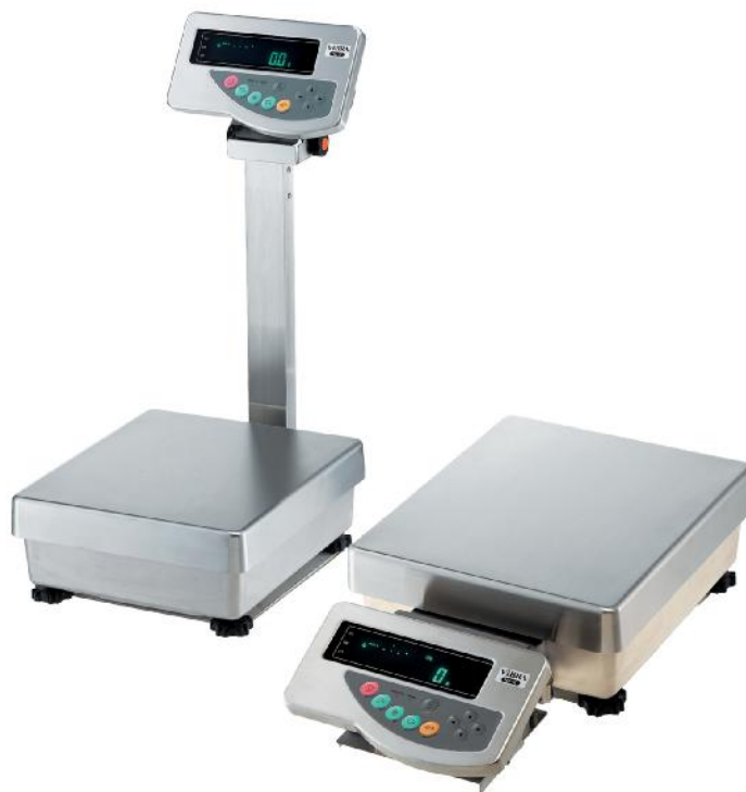
Рисунок 1 - Общий вид весов неавтоматического действия НН.

Принцип действия весов основан на преобразовании частоты вибрации акустического весоизмерительного датчика, возникающей при его растяжении или сжатии под действием взвешиваемого груза, в цифровой электрический сигнал, изменяющийся пропорционально массе взвешиваемого груза. Результаты взвешивания выводятся на дисплей.